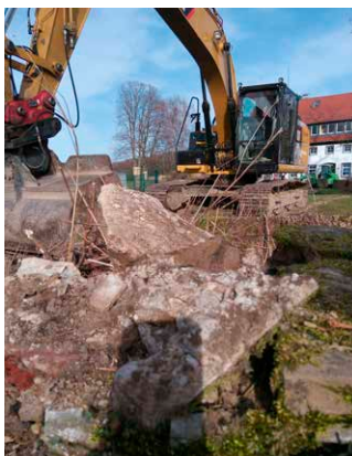
Erster Durchbruch unserer Natursteinmauer