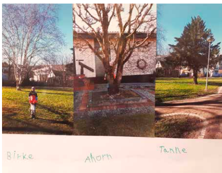
Tolle Fotocollage als Quizantwort