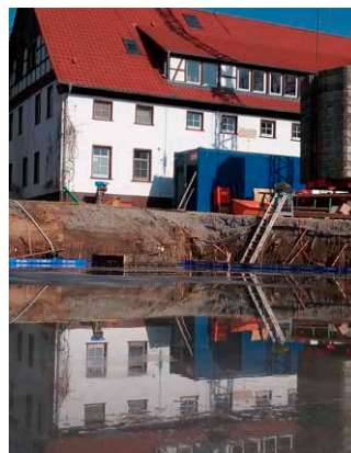
Unser historisches Haus spiegelt sich in der Zukunft

Es ist soweit: Die Bagger sind angerollt, altes Inventar wird zu Kleinholz und wahrhaft kein Stein bleibt mehr auf dem anderen. Wir bauen eine neue Akademie, ein neues Gästehaus und bei der Gelegenheit machen wir auch gleich unser schönes altes Schullandheim noch schöner – und natürlich moderner! Unser sowieso schon großes Gelände wird nochmal erweitert und ein abenteuerlicher Naturerlebnispfad mit vielen Stationen sowie spannende Naturbaustellen entstehen. Doch bis dahin ist es noch ein weiter Weg... Verfolgen Sie unsere Fortschritte, Rückschläge, Freude und Frust auf Facebook (@SchullandheimBarkhausen), auf Instagram (@kupferklaus_barkhausen) oder auf unserer Website.