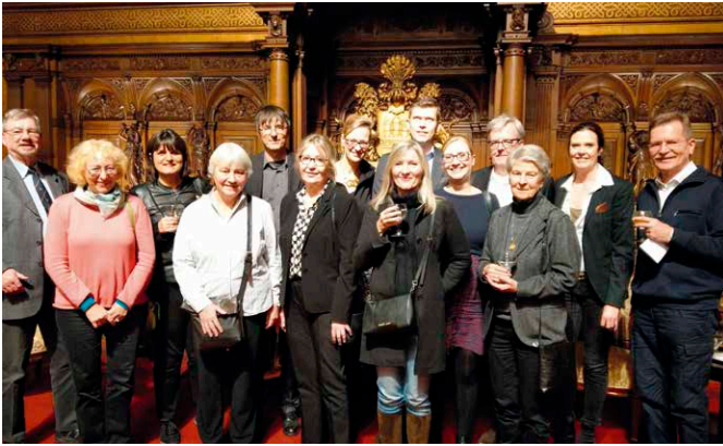
mitKids PatInnen werden im Rathaus geehrt