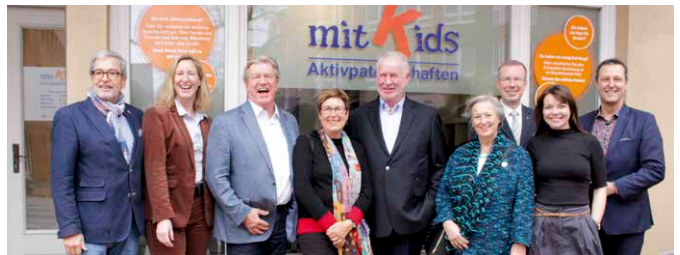
Unterstützende, WegbereiterInnen, PartnerInnen und und Projektverantwortliche freuen sich über den neuen Standort