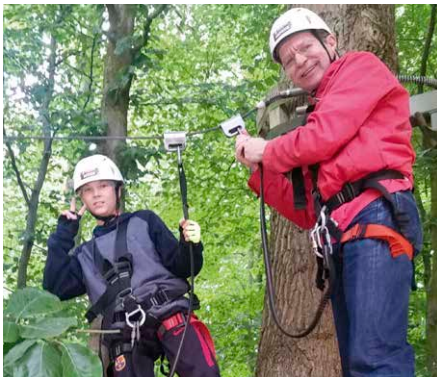
Bahn frei für unsere schwindelfreien Tandems

Unser Sommer-Ausflug führte uns dieses Mal in luftige Höhen. Der Kletterwald Volksdorf lockte mit sieben spannenden Parcours. Unsere ambitionierten Tandems konnten sich je nach Erfahrung für eine niedrigere Route – immerhin auch schon 2 m hoch – oder für bis zu 10 m hohe Routen entscheiden. Damit war für jeden etwas dabei. Zum Schluss mussten alle die ultimative Mutprobe bestehen, als sie mit Karacho mit