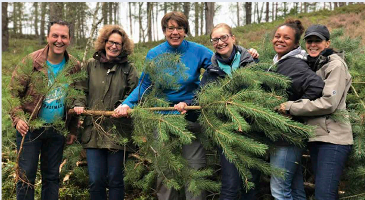
Fridays for Future in der Fischbeker Heide

Auch wir als Stiftungsteam wollten am 20. September, dem globalen Tag des Klimastreiks, einen sinnvollen Beitrag zum Naturschutz leisten. Ganz „Hands-on“ befreiten wir ein Stück der nahe gelegenen Fischbeker Heide von unerwünschten Anwohnern.