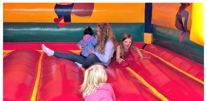
Großer Tobe-Spaß in der Hüpfburg

Dieses Jahr hatten wir das große Glück, unser Sommerfest im Haus der Jugend der AWO feiern zu können. Vielen Dank an das tolle Team vom Jugendwerk für die tatkräftige Unterstützung! Viele Aktionen für Groß und Klein wie Kinderschminken, Tischtennis, eine riesige Hüpfburg und große Soccer Bälle sorgten für Spaß. Die Bühne gehörte den Kindern und es konnte gesungen und getanzt werden. Bei Grillwürstchen und einem leckeren Buffet blieb kein Gast hungrig. Dazu gab es Zeit zum gemeinsamen Erfahrungsaustausch zwischen Patinnen und Paten, Familien und Kindern.