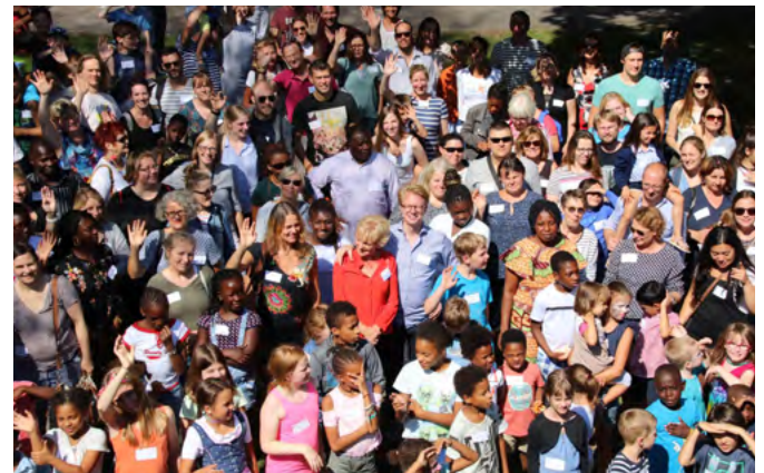
Die mitKids-Familie wird immer größer