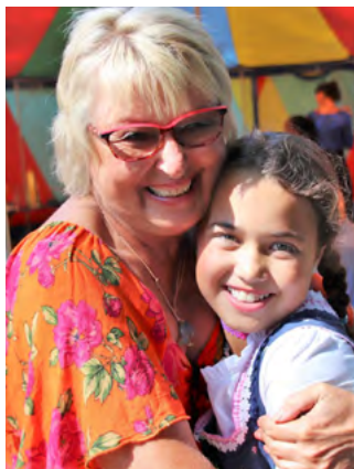
Ein strahlendes Tandem