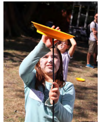
Hier ist Geschick gefragt