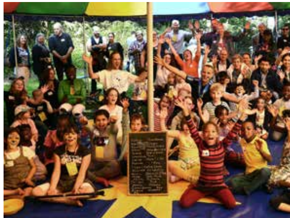
Großer Applaus für die Artisten