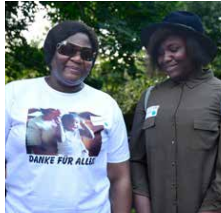
mitKids der ersten Stunde