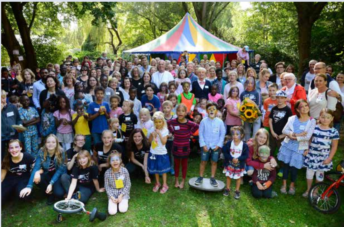
Die große mitKids-Familie