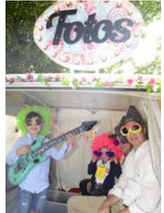
Spaß in der Foto-Box