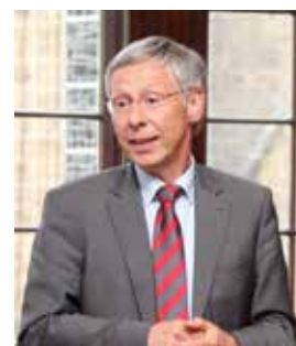
Dr. Carsten Sieling

„Es freut mich, dass Sie unsere Stadt für Ihr neues Projekt auserkoren haben, um auch hier Kinder zu fördern, die unsere ganz besondere Aufmerksamkeit und Unterstützung verdient haben.“ Bürgermeister der Stadt Bremen, Dr. Carsten Sieling