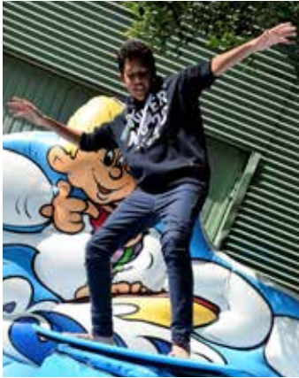
Auf dem Surf-Simulator