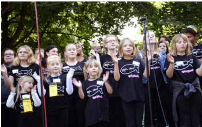
The Glad(e)makers Chor aus Bremerhaven sangen den mitKids-Song