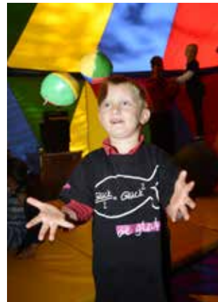
Probe für den großen Auftritt